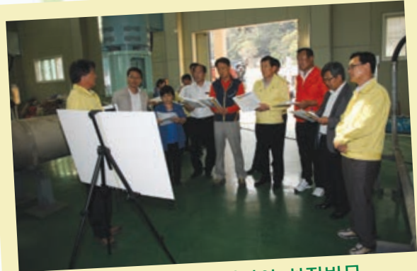
도시건설위원회 재해피해지역 현장방문 9월 19일 도시건설위원회(위원장 황일두)는 태풍 '산바'로 침수피해를 입은 진해구 용원동 원남·원북마을을 현장방문하였다.