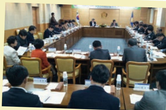
창원시의회와 전주시의회 공동세미나 개최

복지시책개선연구회(대표의원 심경희)는 10월 30일 센터를 방문하여 시설 및 운영 프로그램 현황 파악과 애로사항을 청취하였다.