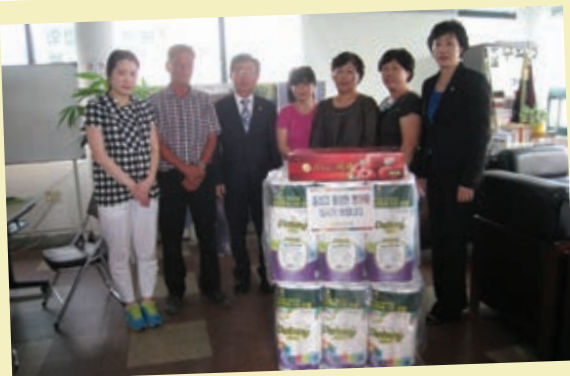
검소하고 훈훈한 추석맞이 어려운 시설 위문 방문

제24회 제2차 정례회 예산결산특별위원회(위원장 손태화)는 2013년도 예산안 및 기금운용계획안과 2012년도 제2회 추경 예산안을 심사하였다.