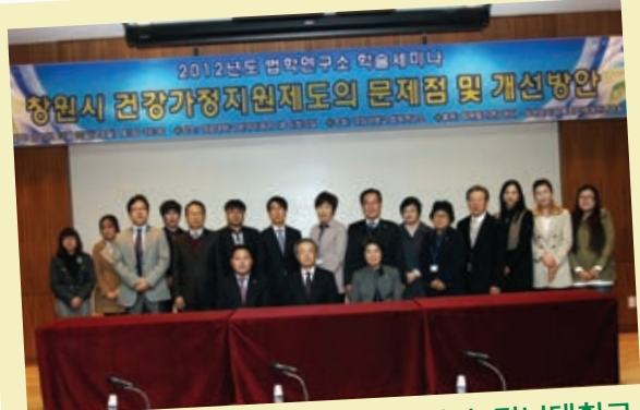
창원시의회-복지시책개선연구회와 경남대학교 법학연구소 학술세미나 개최

11월 1일 전주시에서 전주시의회와 「시·군 통합이 미치는 발전적 미래전망」이라는 주제로 공동세미나를 개최하였다.