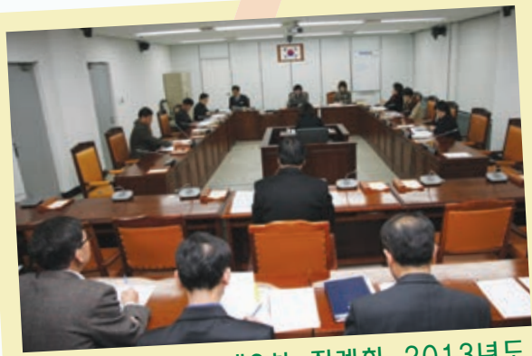
의회운영위원회 제2차 정례회 2013년도 예산안 및 제2회 추경 예산안 심사 의회운영위원회(위원장 정우서)는 정례회 기간중 2013년도 세입·세출 예산안과 제2회 추경 세입·세출 예산안을 예비심사 하였다.