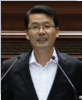
박철하 의원 (균형발전위원회)

※ 보다 상세한 내용은 창원시의회 홈페이지( http://council.changwon.go.kr ) 의정활동(시정 질문/답변) 회의록을 검색하여 주시기 바랍니다.