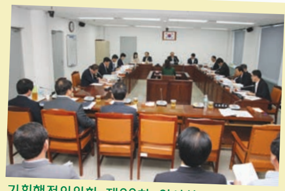
기획행정위원회 제22회 임시회 제1회 추경 예산안 심사 9월 10일 기획행정위원회(위원장 장동화)는 제22회 임시회 제1회 추경 세입·세출 예산안을 예비 심사 하였다.