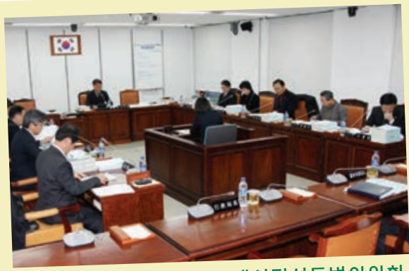
제24회 제2차 정례회 예산결산특별위원회 -2013년도 예산안 및 제2회 추경 예산안 심사

제22회 임시회 예산결산특별위원회(위원장 김문웅)는 2012년도 제1회 추경 세입·세출 예산안을 심사하였다.